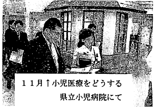
11月↑小児医療をどうする 県立小児病院にて