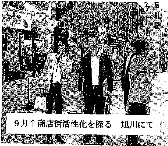
9月↑商店街活性化を探る 旭川にて

○野菜の安心のため、農業等管理システム導入 今回 JAいるまのはじめ6JA、21カ所に生産履歴登録適合システムの機器を入れる。